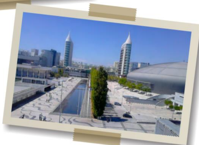
Parque das Nações