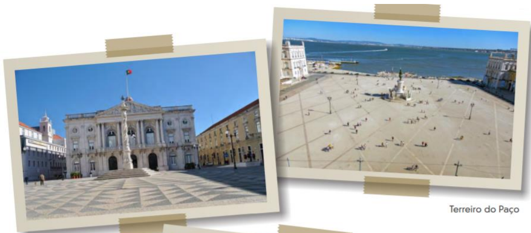
Praça do Município